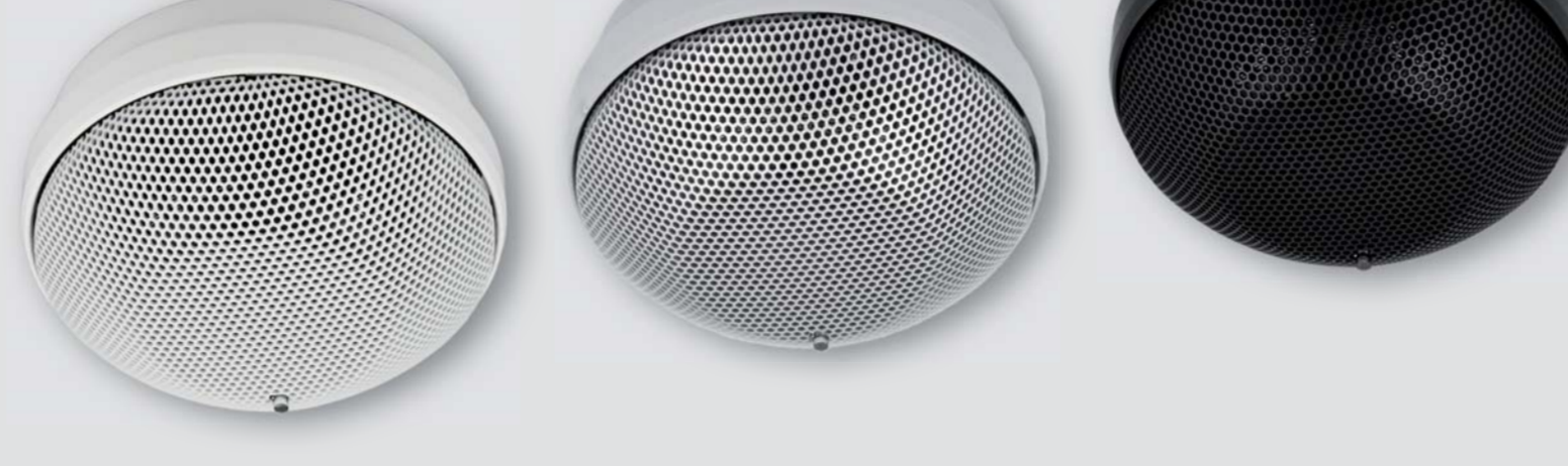
HD 3001 O