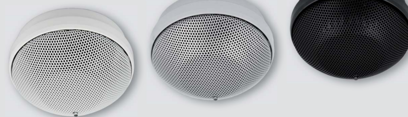
CT 3001 O

Kombinovaný opticko - kouřový a teplotní