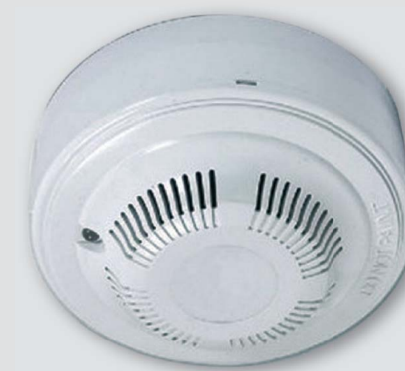
GD - 983 - CO

Detektor oxidu uhelnatého s poplachovým NC relé pro instalace EZS.