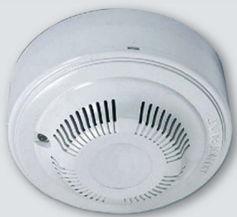
GD - 983 - NG

Detektor zemního plynu s poplachovým NC relé pro instalace EZS.