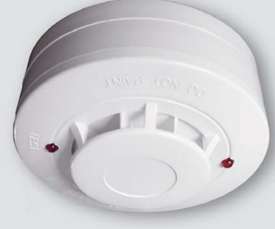
FDR - 16 HR