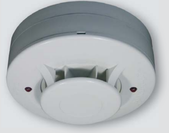
FDR - 26 S

Detektory s výstupem relé a napájením 12V. Detektory jsou samoresetovací. Po odeznění aktivačního stavu samy přecházejí do klidu.