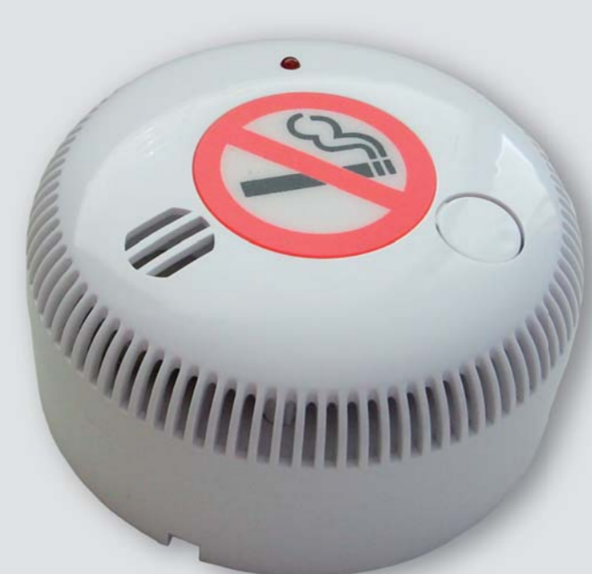
CDA - 707

Autonomní detektor cigaretového kouře s akustickou signalizací.