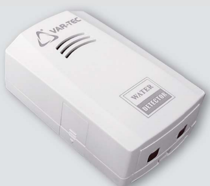
WLD - 38R

Detektor zapalvení pro včasné zjištění úniků vody (autonomní i jako součást EZS).