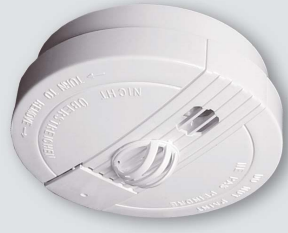
FDA - 730 - HR