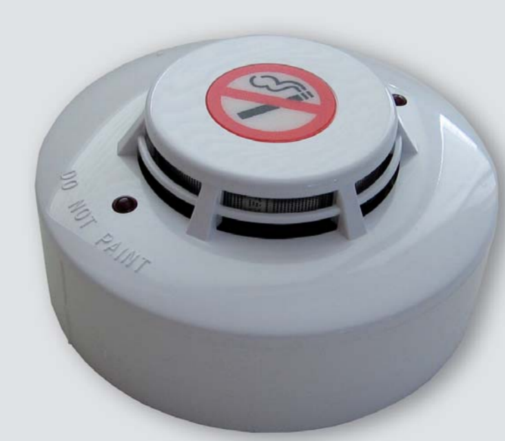
CDR - 727

Detektor cigaretového kouře s integrací do systémů EZS (NC relé výstup).