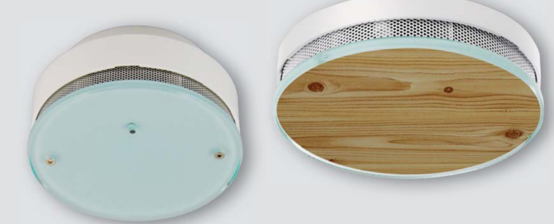
CT 3005 O

Opticko - kouřový, design - sklo, možnost vlastního polepení