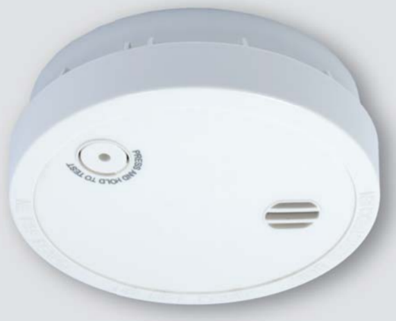
FDA - 739 - S

Detektory jsou osazené baterií 9V a mají vestavěnou sirěnu pro signalizaci poplachu. Stav detektoru signalizován LED.