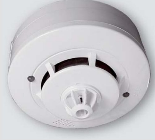
FDR - 36 SHR

Kombinovaný opticko - kouřový a teplotní